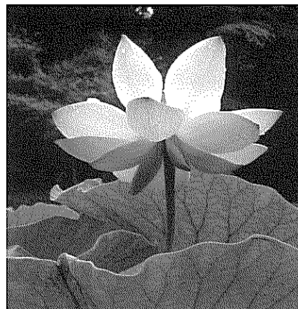
*花展会場：B2F エスパス OHARA 1階ロビー